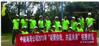
中骏海湾公司2013年“凝聚你我，共赢未来”拓展训练

而解。接下来还有“鼓动人心”这个项目，让大家非常清晰的知道个人与团队的关系，增强对“信任、责任”的认知及进行团队协作、团队融合。最后是“七巧板”项目，让大家体验领导力在团队中的认知，资源整合的重要性。这一系列活动的开展，使我们每一个员工都在一定程度上挑战了自我极限，提高了自身素质修养。两天一夜的拓展训练在欢声笑语中结束了，每位员工都表示在这次拓展训练中，不仅锻炼了体魄，更多的是收获了精神上的力量。充分认识到一个整体时，团队协作精神是整个团队的灵魂，对于自身的工作方法和与人沟通的方式也有了进一步的思考，使自己充满正能量，让自己对工作能力更加有信心，使自己在今后的工作中，能够更加专注，更加用心，为公司的强健发展贡献自己的每一份热情。